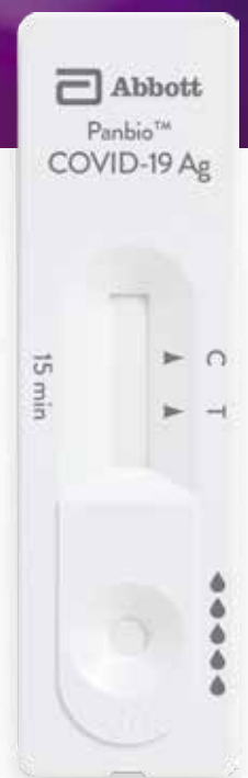
Panbio™ COVID-19 Ag Rapid Test Device